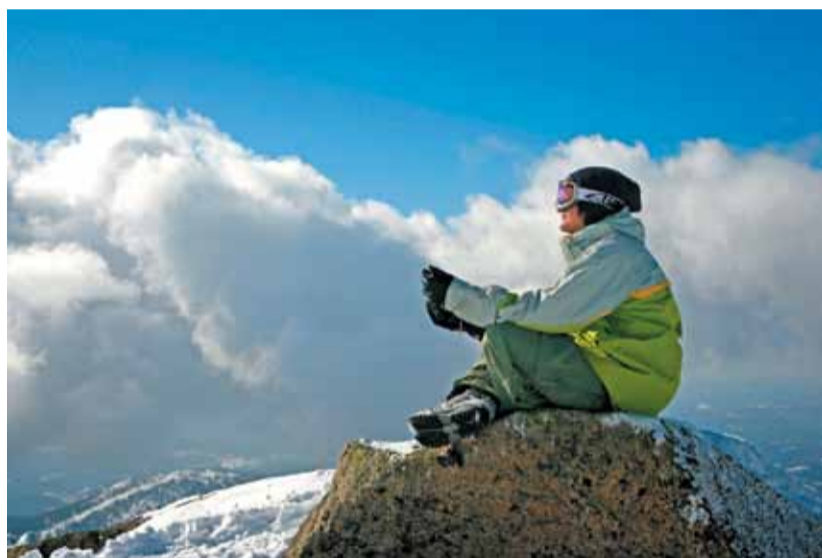
Шерегеш. Взгляд в будущее

Этому, кстати, очень помогает высокий рейтинг региона. Вспомним: рейтинговое агентство «Эксперт РА» в третий раз отнесло Кузбасс к классу заемщиков с высоким уровнем надежности.