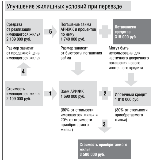
Схема 2. Как принять участие в программе